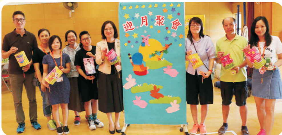
本會家長委員與何校長、蘇主任合照