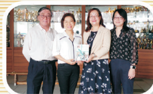
麥明詩父母和校長及主席來一張合照。