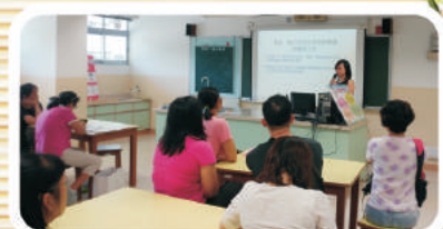
我們一起學習避免子女接觸不良資訊。