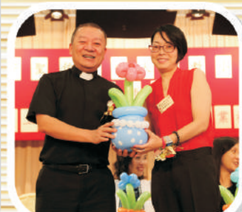
本會主席感謝校監陳神父抽空出席學堂畢業禮