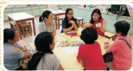
一年級的家長小組。