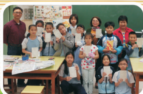
西星老師教導大家雕刻。