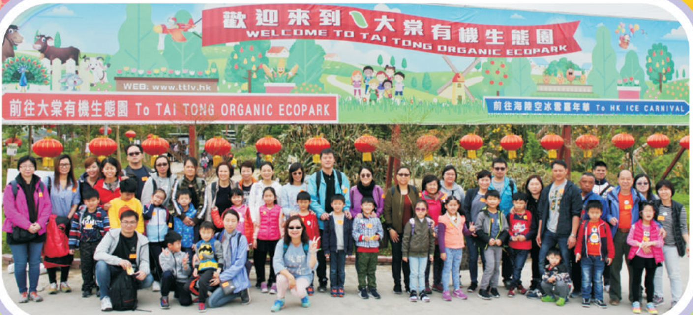
何校長與參與家長及學生合照

家長教師會於2018年3月18日舉行一年一度的親子大旅行，是次活動由東華三院利東綜合服務中心協辦。活動當日，家長、孩子與老師一起在大棠有機生態園參與多元化的親子及自然教育活動，讓我們在基督復活期的日子裏，一方面一同欣賞天主創造世界的偉大和奧妙，另一方面亦鼓勵大家從生活中尋找樂趣，從樂趣中享受綠色生活。