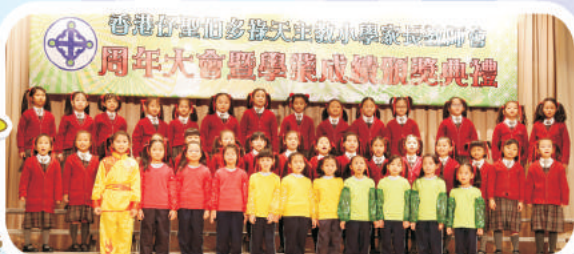
學生表演-女子英語集誦