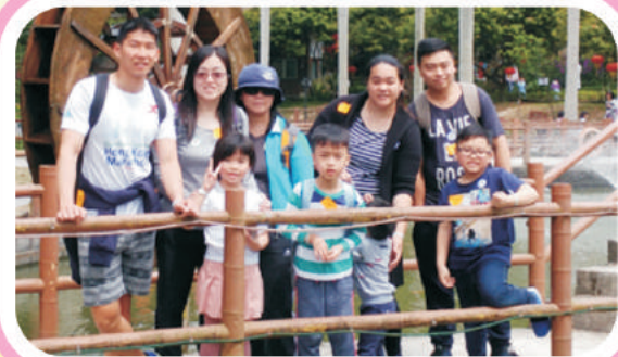
學生、家長與老師合照