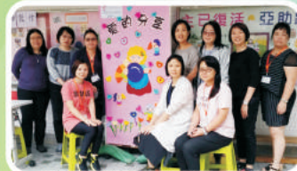
母親節前夕的攤位活動，提醒孩子要親親媽媽。