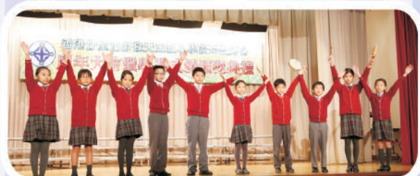
學生表演 - 合唱小組