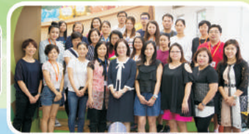
故事姨姨叔叔合照