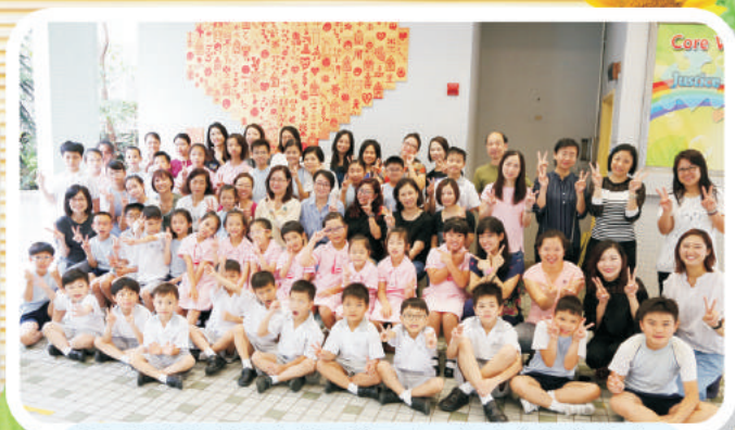
「石膏板雕刻班」親子義工來一張大合照作紀念。